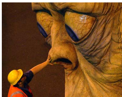
Установка Голлума в Аэропорту Веллингтона